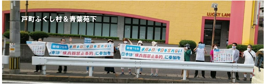
戸町ふくし村 & 青葉苑下