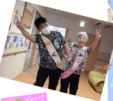
なくそう! 核兵器 #おうちで 平和行進 2020長崎