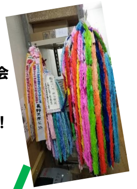
長野と山形から 千羽鶴が！