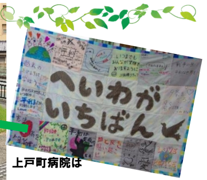
上戸町病院は タペストリーを製作