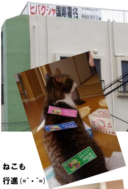
ねこも 行進 (=・'=)