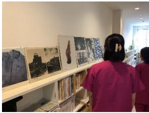
花丘診療所はパネル展