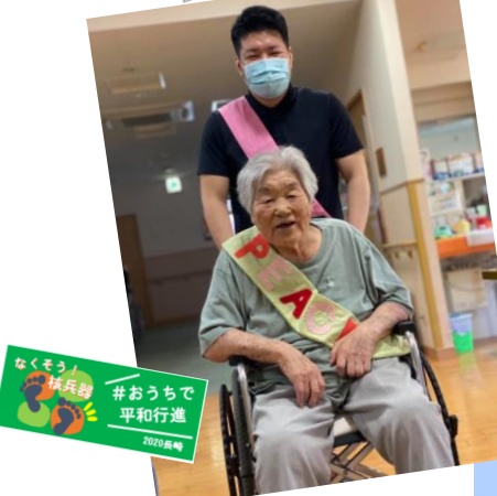
なくそう! 核兵器 #おうちで 平和行進 2020長崎